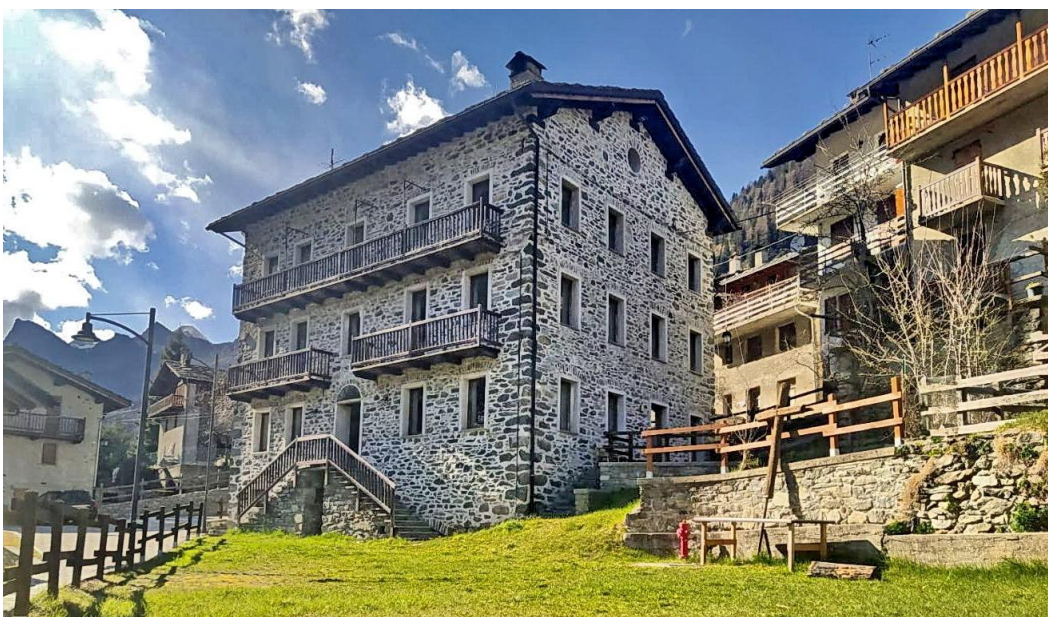
Il nostro alloggio a Casa Verana (tutta per l'Angolo di Besnate)