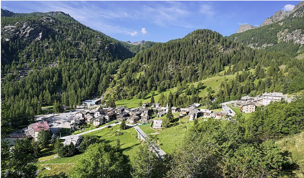
Chardonney nella valle di Champorcher